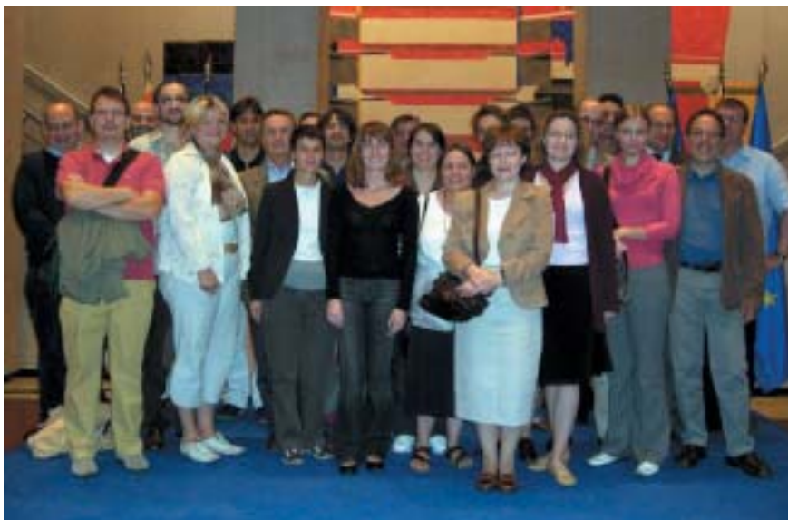
Uczestnicy wizyty studyjnej, Marsylia, 2–6 października 2006 roku