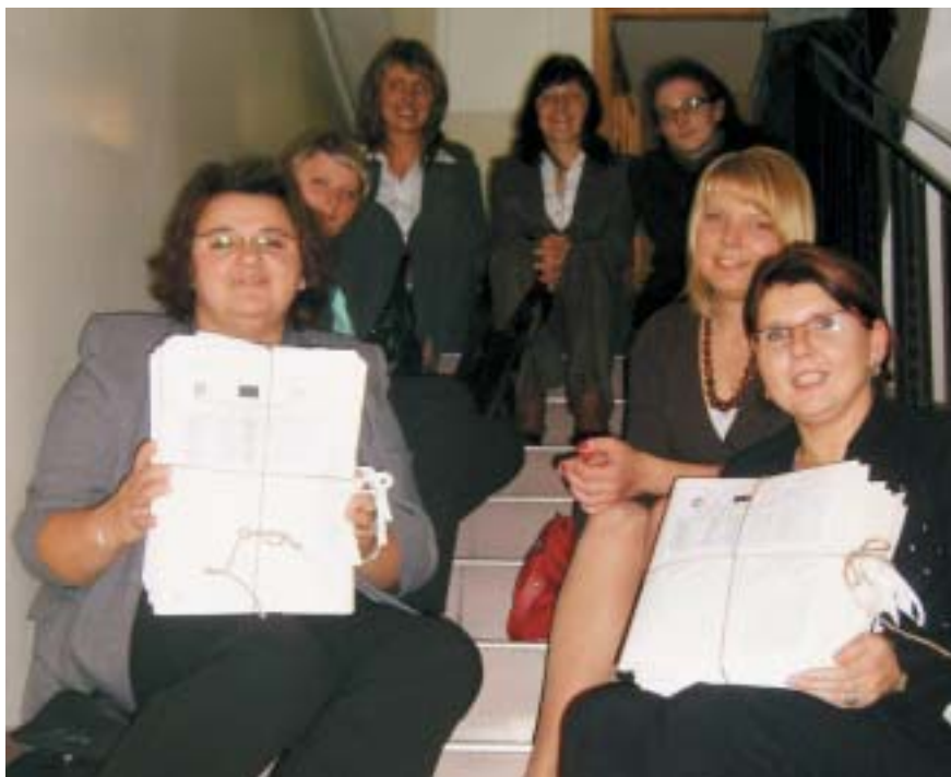
Studenci 2. rocznika studiów oczekujący na wyniki egzaminu dyplomowego, wrzesień 2007 r.

Zajęcia realizowane są przez doświadczonych pracowników Uniwersytetu Warszawskiego, a nieliczne, specjalistyczne przedmioty prowadzone są przez wysoko wykwalifikowanych trenerów. Wysoki poziom merytoryczny zajęć utrzymywany jest również dzięki sukcesywnie powtarzanej ankiecie ewaluacyjnej wypełnianej anonimowo przez słuchaczy studiów, w której oceniają oni zarówno jakość prowadzonych zajęć, jak również ich przydatność w dalszej pracy zawodowej. Między innymi dzięki wnioskom z tej ankiety program studiów jest na bieżąco korygowany i dostosowywany na przykład do zmieniającej się sytuacji prawnej w przepisach dotyczących publicznych służb zatrudnienia.