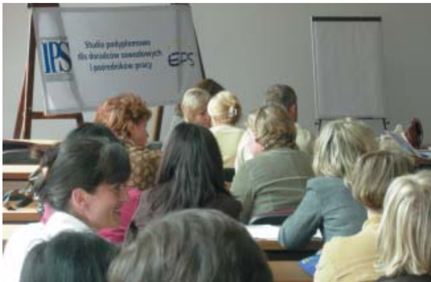
Inauguracja 1 rocznika studiów podyplomowych dla doradców zawodowych i pośredników pracy