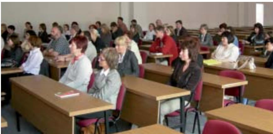
Studenci pierwszego rocznika Studiów Podyplomowych dla doradców zawodowych i pośredników pracy na wykładzie