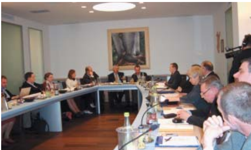
Spotkanie w Federazione Trentina, 12–17 marca 2007 roku