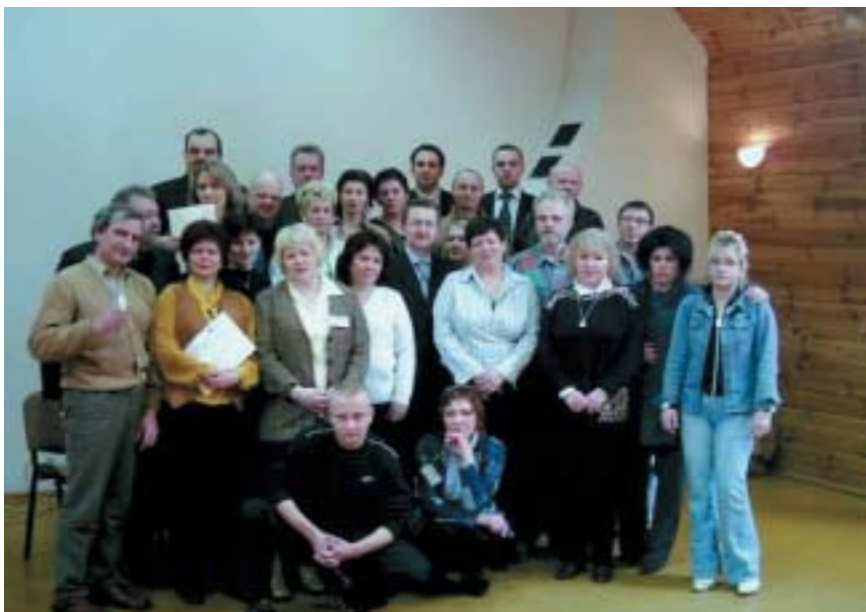
Uczestnicy I Międzynarodowej Letniej Szkoły Gospodarki Społecznej, Guzowy Piec k. Olsztyna, czerwiec 2006