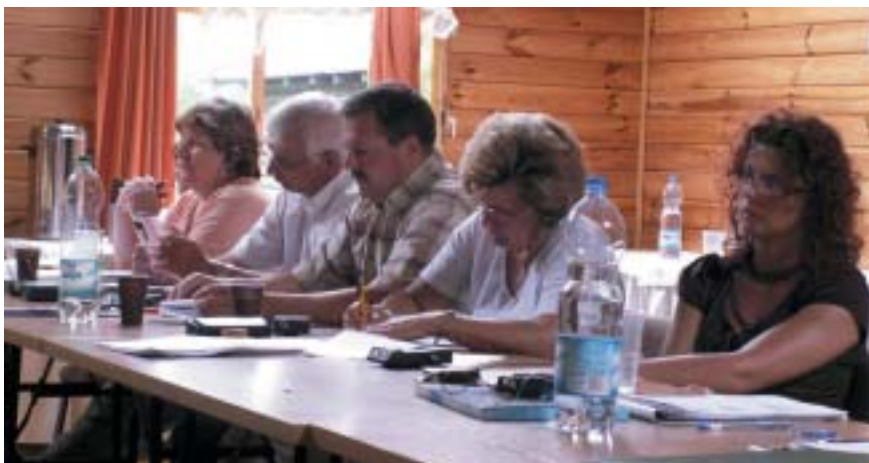
Uczestnicy I Międzynarodowej Letniej Szkoły Gospodarki Społecznej, Guzowy Piec k. Olsztyna, czerwiec 2006

uczestnika lokalnej polityki społeczno-gospodarczej. Projekt realizuje założone cele, prowadząc działania edukacyjne, badawcze, wspierające i promocyjne na rzecz gospodarki społecznej za pomocą nowatorskich struktur powołanych w ramach Partnerstwa.